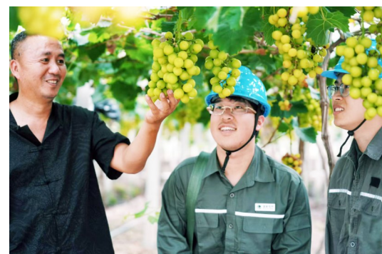
深入葡萄果园开展用电保障服务。