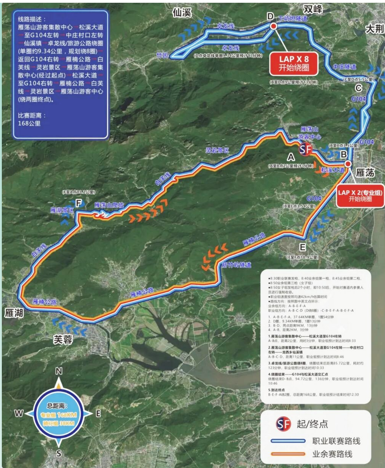
2025年中国公路自行车职业联赛(雁荡山站)路线图。