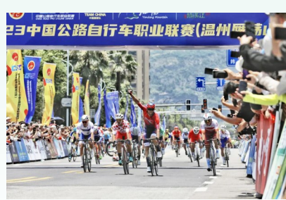
2023年中国公路自行车职业联赛(温州雁荡山站)比赛。(资料图)

备受瞩目的中国公路自行车职业联赛(雁荡山站)暨第三届雁荡山骑行大会将于9月28日(星期日)在乐清市雁荡山景区火热开赛,作为国内顶级公路自行车赛事,也是唯一的国家级职业联赛,此次赛事必将吸引众多目光。随着赛事日益临近,乐清市已做好充分准备,热情迎接各方选手和观众的到来,共同见证这场精彩纷呈的自行车赛事。