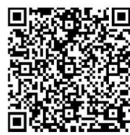
扫一扫 进反诈专区 看更多内容

“百万医疗保险”业务会自动扣费或影响个人征信，要求转账至指定账户的，都是诈骗！广大市民如接到陌生来电或遇到类似情况时，要保持警惕，尤其涉及账号密码、转账汇款时务必警惕，如有疑问，请及时拨打057796110或110进行咨询。