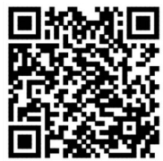
扫一扫 看视频 朱洁珍 制作

了解情况后，考虑到老人腿脚不方便，饿着肚子长时间推着轮椅，体力有些透支，民警立即将情况汇报给中队值班室，随后带着老人到中队休息，并为老人买来食物填饱肚子。待老人休息好后，安排警车将老人平安送至家中。