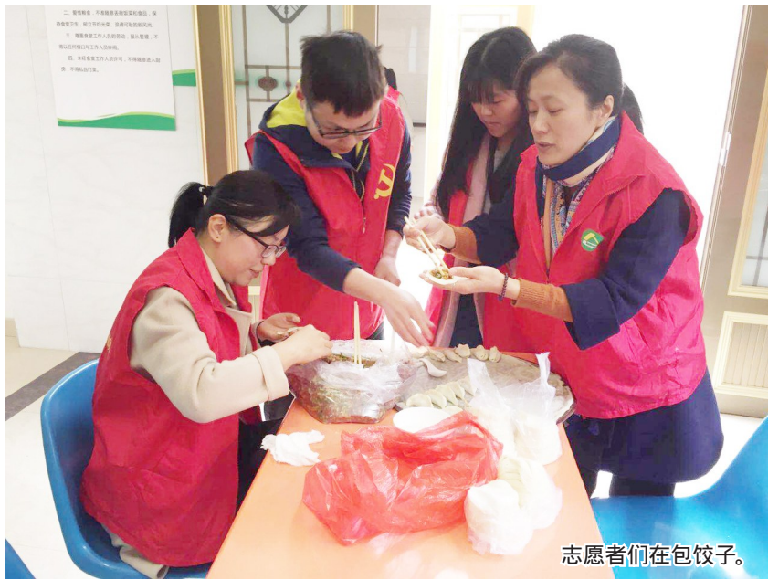
志愿者们在包饺子。

当天，志愿者们还在敬老院食堂里给老人们包饺子，让老人家们感受到贴心的温暖和关怀。