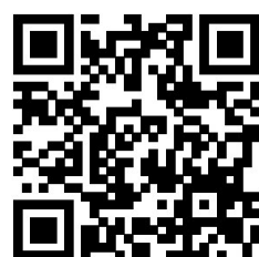
扫一扫看视频 陈青 摄 曾盼 制作

据悉，秦垵南村位于乐清西北部山区海拔500多米，是一个四面环山、风景秀丽的村庄。近些年来，秦垵南村通过改造，发生了翻天覆地的变化。村里通了公路，村民走出了大山，迈上了致富道路，靠自己的辛勤劳动，提高经济收入，并盖了新房子，村庄面貌焕然一新。2015年，村里建成了文化礼堂，成为了村民的文化体育活动阵地，定期开展各类演出和活动，丰富了村民的文化生活。