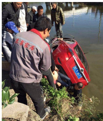
救援现场。(请图片作者与本报联系)