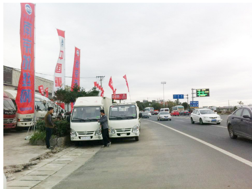
待售车辆占据了非机动车道。