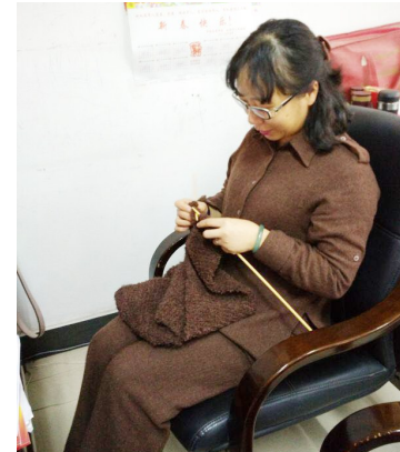
母亲学堂学员织围巾。

围巾编织后，捐赠给柳市敬老院、城南敬老院、柳市镇黄华社区南山前村居家养老中心，以及盐盆街道的孤寡、困难、空巢老人。